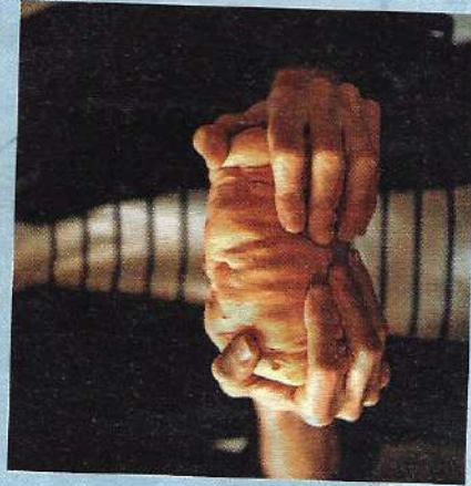
Il processo creativo di trasformazione dei flaconi in vetro dei profumi in oggetti decor dall'anima sostenibile.

A fare tutto il resto ci penseranno dei giovani creativi, maestri di quella materia plasmabile e virtuosa (ed eterna, riciclabile all'infinito) che è il vetro. In particolare, saranno i professionisti di Rehub, startup basata a Murano, specializzata nella trasformazione degli scarti di vetro in oggetti di design. Attraverso un processo innovativo, il team di Rehub trasformerà i flaconi in nuovi pezzi unici, fatti a mano, che torneranno nelle profumerie Ethos sotto forma di accessori, piccoli bijoux e pezzi decor nel prossimo mese di ottobre.